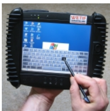
DT368-XP: Testen Sie es !

Da es sich um Windows XP handelt , können sowohl Drittanbieterlösungen installiert werden, z.B. für mobile Datenerfassung, Navigation, Barcodeerfassung, etc., wie auch die gängigen MS Office-Applikationen. Der Software-Weltmarkt steht zu Ihrer Verfügung!